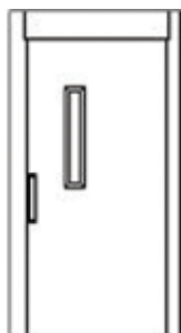
Branddør med glas