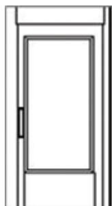
Stort glas flet (standard)