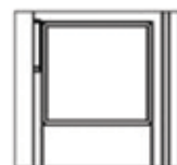
Halv højde med glas